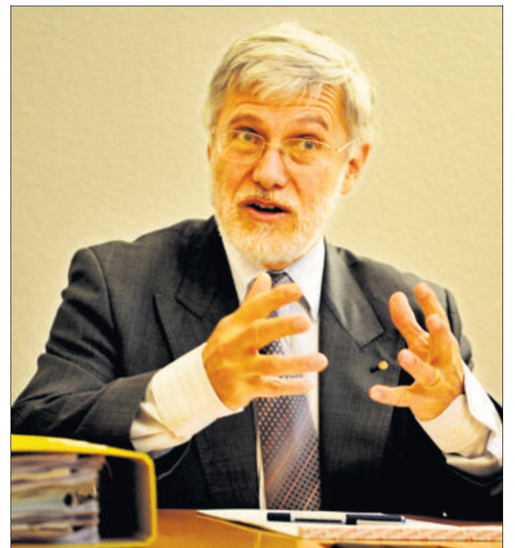
Fernand Savigny. Un maire en colère. (PIERRE ABENSUR)

J'ai déjà agi dans mon rôle de membre du collège qui suit notamment les projets de trois bureaux d'urbanistes-architectes. J'ai été consterné, par exemple, quand j'ai lu dans leur cahier des charges que le Conseil