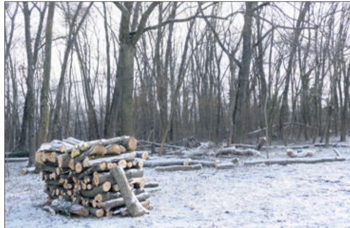
Le Petit Bois. L'abattage en cours est destiné à l'éclaircir.

Tout ce travail de bûcheronnage est réalisé par les trois cantonniers de la commune, en plus de leur travail habituel. C'est dire qu'ils ne pourront vraisemblablement pas termi-